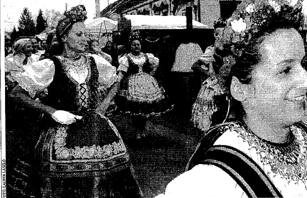
Idén is számos látványos program hívogatta a látogatókat az elmúlt hétvégén megrendezett pécsváradai Leányvásár

ÉRTÉKEK Hagyományosan az egész kistérség ünnepe