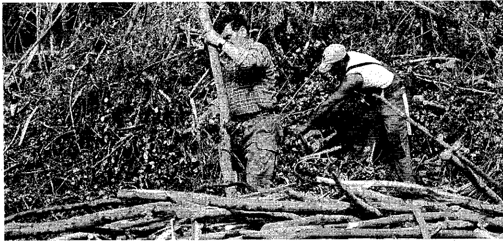
Egy pályázat révén lehetőség nyílt arra, hogy erdőművelőket és mezőgazdasági munkásokat képezzenek

PÁLYÁZAT A pályakezdőket, a tartós munkanélkülieket segítik